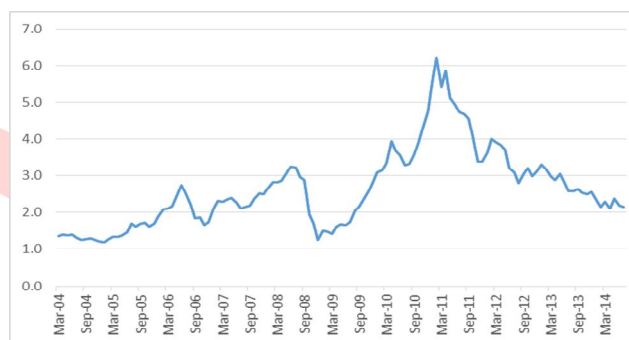
روند قیمت جهانی کائوچو (واحد دلار به ازای هر کیلوگرم)

❖ نمودار بالا روند قیمت کائوچو طی ۱۰ سال گذشته را نشان می دهد. همانطور که ملاحظه می شود، در جولای سال ۲۰۱۴ قیمت کائوچو به طور متوسط ۲،۱ دلار به ازای هر کیلو گرم بوده است. با توجه به نمودار و نظر کارشناسان رشد قیمتی برای کائوچو متصور نیستیم.